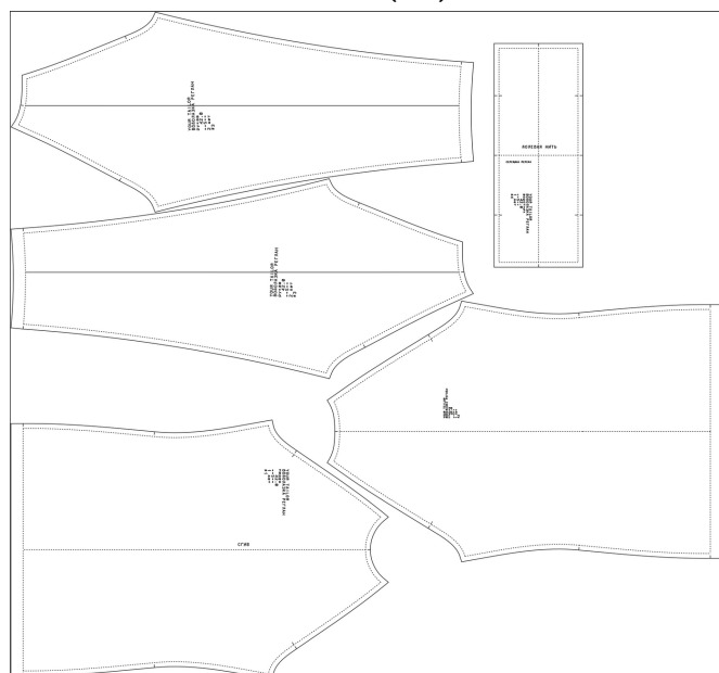
РАЗМЕР XL(48) - 1.35М